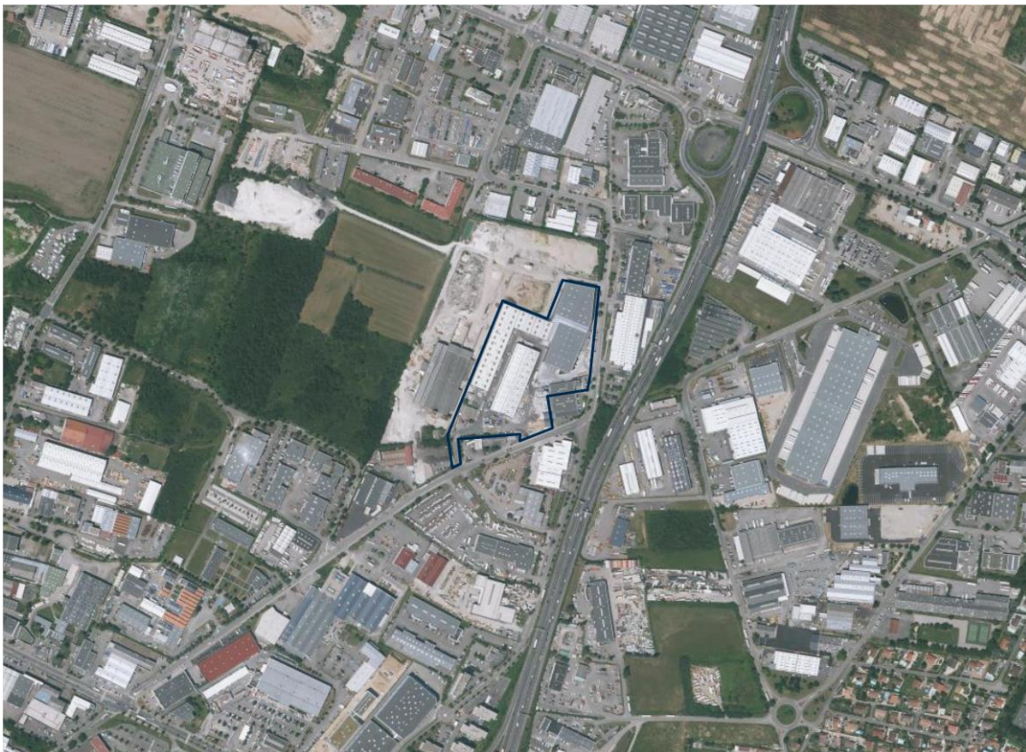
Photographies aériennes du site - 2020