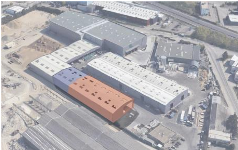
Photographies du projet de bâtiment à reconstruire